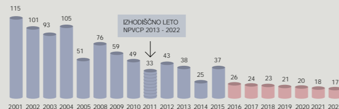
ŠTEVILO MRTVIH ZARADI VOŽNJE POD VPLIVOM ALKOHOLA V OBDOBJU 2001 - 2015 TER CILJ DO LETA 2022