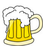
Pivo 2,5 dl 5 % alkohola

Najpogosteje se alkohol povezuje z prehitro vožnjo, nepravilno stranjo ali smerjo vožnje in neupoštevanje prednosti.